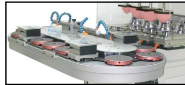
- Diferentes tamaños de conveyor.