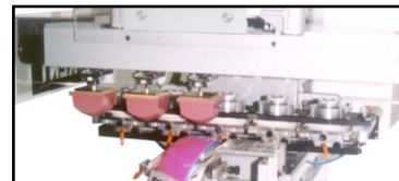
- Fijación de lanzadera de tampón DPS multi-color.