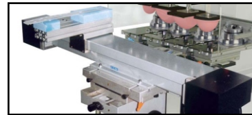
- Fijación de lanzadera digital.