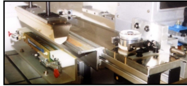
- Tintero lateral para la impresión de imágenes largas (SCMIC).