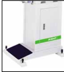
- Bancada máquina (MS-100)