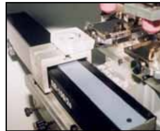
- Lanzadera de 2 colores (DR-150/2S)